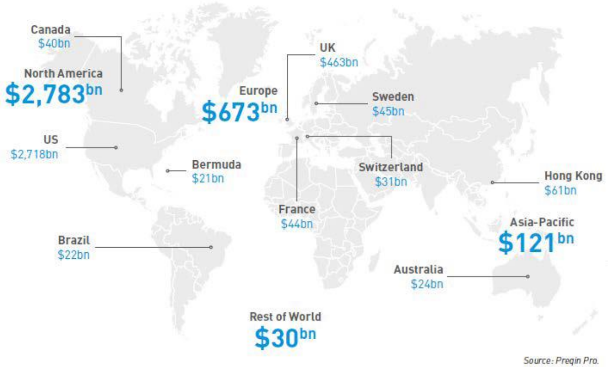
شکل ۱. ارزش دارایی‌های تحت مدیریت صندوق‌های پوشش ریسک در کشورهای مختلف (پروکویین، ۲۰۲۰)

شکل ۱ اندازه صندوق‌های مصون شده را در دنیا بر حسب دارایی‌های تحت مدیریت نشان می‌دهد. با توجه به اینکه هنوز دارایی تحت مدیریت ۴۵٪ صندوق‌های مصون شده ۱۰ الی ۱۰۰ میلیون دلار است، به نظر می‌رسد هنوز پتانسیل زیادی برای رشد کمی و کیفی این صندوق‌ها وجود دارد.