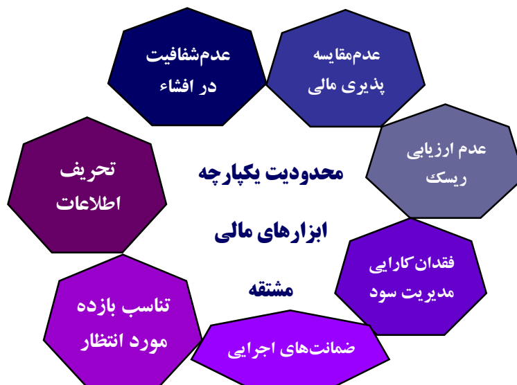
شکل ۳. چارچوب نظری پژوهش (منبع: یافته‌های پژوهش)

نتایج پس از دو دور تحلیل دلفی نشان داد که تمامی مؤلفه‌های پژوهش براساس ضرب توافقی و میانگین مورد تأیید قرار گرفتند. براین اساس چارچوب نظری پژوهش در قالب شکل ۳ ارائه می‌شود.