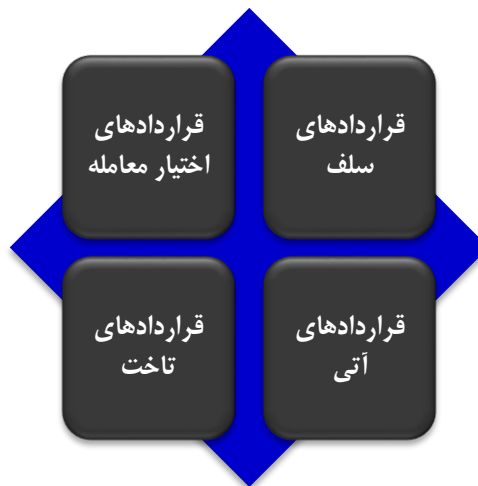
شکل ۱. تفکیک مشتقات مالی

خام؛ طلا؛ ارز؛ سهام؛ شاخص سهام؛ نرخ بهره و حتی یک مشتقه دیگر باشد. به عبارت دیگر، مشتقات در حوزه مالی به قراردادهای مالی اشاره دارد که بازده آنها با تغییر در ارزش سهام؛ اوراق قرضه؛ موجودی کالا؛ ارز؛ نرخ بهره؛ شاخص سهام یا سایر دارایی‌ها مرتبط بوده و یا از آنها ناشی می‌گردد، تغییر می‌کند (اسپرز ۱ ، ۲۰۱۹). در واقع این مشتقات در برگیرنده طیف وسیعی از ابزارها هستند که اگرچه هر کدام از مشتقه‌ها دارای ویژگی خاصی هستند، اما وجه مشترک تمامی آنها براساس قرارداد انتقال ریسک و کسب بازده طی توافق بین طرفین می‌تواند تلقی گردد. به عبارت دیگر طرفین توافق می‌کنند که به محض دریافت هزینه‌ای مشخص، ریسک زیان طرف دیگر را در صورت بروز واقعه‌ای خاص و به ویژه در ارتباط با ارزش دارایی دیگری، بر عهده بگیرد که این دارایی همان دارایی مرجع یا پایه است (پارک و کیم ۲ ، ۲۰۱۵). هرچند توجه به این نکته مهم است که مشتقات می‌توانند بدون نیاز به مالکیت واقعی دارایی پایه منتشر و معامله شوند که وجود همین اشتراک‌ها در این ابزارهای مالی است که امروزه مشتقات بخش مهمی از حوزه مالی و تصمیم‌گیری را به خود اختصاص داده است. در یک دسته‌بندی کلی فارگر و همکاران ۳ (۲۰۱۸) مشابه پژوهش‌های گذشته، مشتقات مالی به عنوان ابزارها اختیار فروش تبعی را به چهار حوزه در قالب چارچوب زیر تفکیک نمودند: